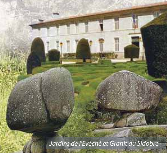
Jardins de l'Evêché et Granit du Sidobre